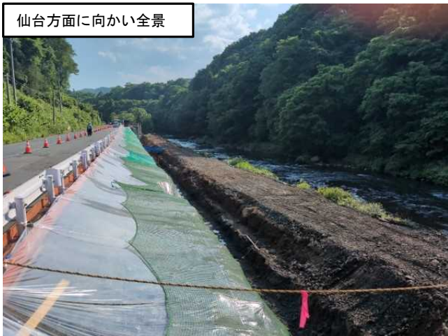
仙台方面に向かい全景